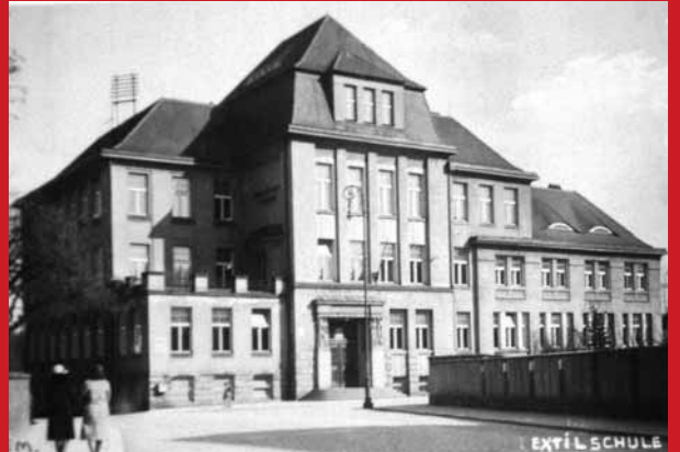
Textilschule byla v Liberci na dnešní křižovatce ulici Jablonecká a Tyršova už začátkem minulého století. Objekt při vnějším pohledu nezaznamenal žádné větší úpravy a je téměř totožný.

V naší rubrice si připomínáme doby dávno minulé a porovnáváme obrázky z různých údobí minulého a předminulého století se současností.