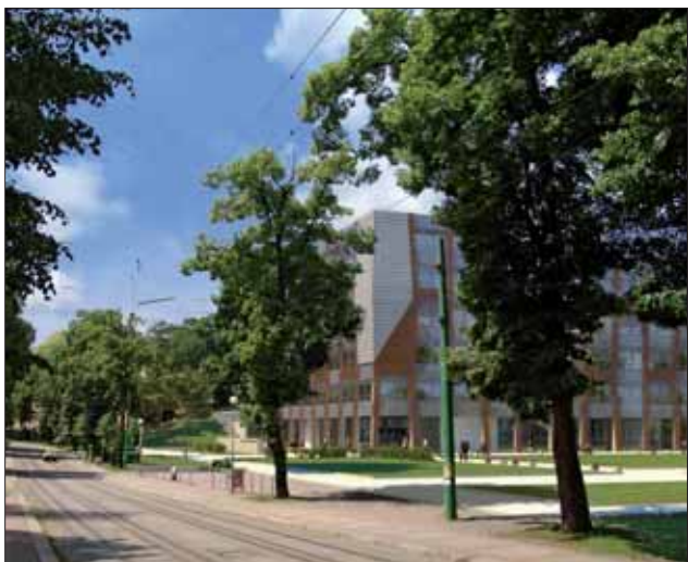
Studie Centra vzdělanosti LBC kraje. To má vyrůst na místě současného výstaviště na Masarykově třídě.