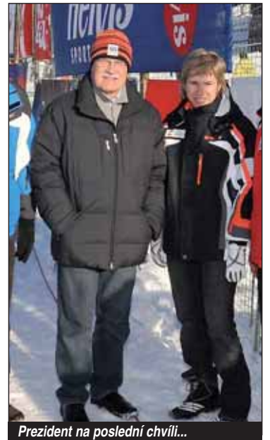
Prezident na poslední chvíli...

Před únorovými SP zmizel sních z tratí ve Vesce během několika týdnů dní.