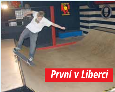
První v Liberci

První vlastnovou v rozvoji skateboardingu v Liberci je vytvoření minimální rampy, jak se správně nazývá, v prostorech Casta clubu.