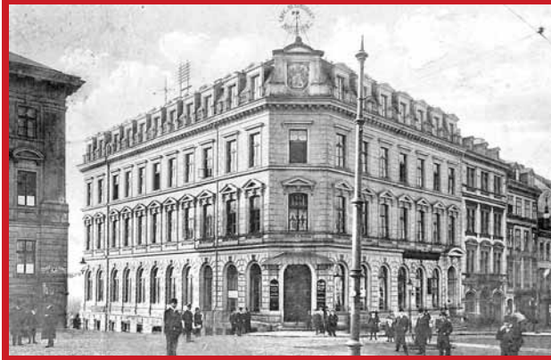
Dnešní Edward's Bar s kulečnickem na Sokolovském náměstí. Před 100 lety to byl Restaurant Kronprinz na Bismarckplatz 1 s denními koncerty.

V naší rubrice si připomínáme doby dávno minulé a porovnáváme obrázky z různých údobí minulého století se současností.