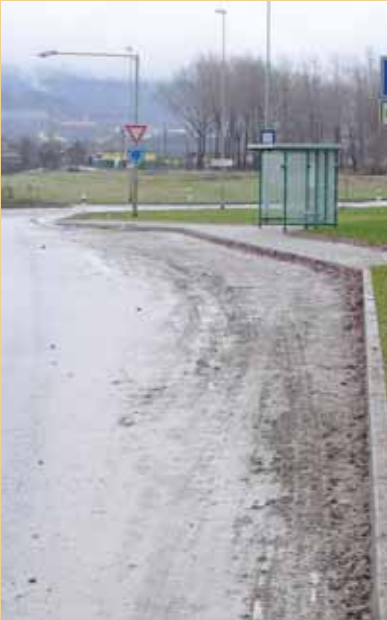
Silnice u druhého kruháče nad Globusem. K čistému asfaltu má skutečně hodně daleko a tu již zde projel kropící vůz.

Existovala do minulého roku. Řešila nejen čistotu ulic a silnic, ale i čistotu ovzduší a další okruhy životního prostředí. Na do-