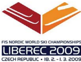
FIS NORDIC WORLD SKI CHAMPIONSHIPS LIBEREC 2009 CZECH REPUBLIC • 18. 2. - 1. 3. 2009