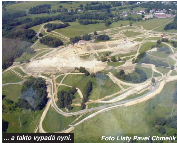
... a takto vypadá nyní.