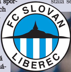
Letos ... nic moc

Liberecké sportovní kluby tedy mají v nové sezoně co napravit. Ale když člověk viděl úvodní vystoupení fotbalového Slovanu na Spartě, tak to asi bude náročné... (jas)