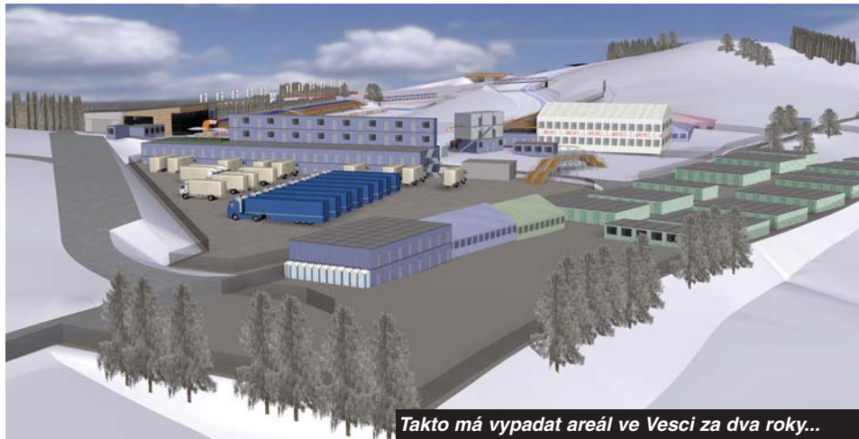
Takto má vypadat areál ve Veselí za dva roky...

Veřejné mínění a média se vcelku jednoznačně staví za předchozí vedení. Mají dojem,