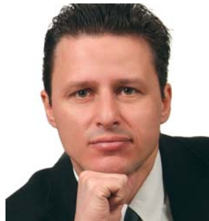
Ing. Petr Pávek, náměstek ministra pro místní rozvoj, starosta

Město investuje do spousty jiných věcí, které by si mohly pomoci samy. Třeba z osmdesátimilionové dotace pro divadlo by se dalo určitě něco ušetřit, návštěvníci by měli platit vyšší vstupné, tak jako to musí dělat třeba fanoušci fotbalu nebo hokeje.